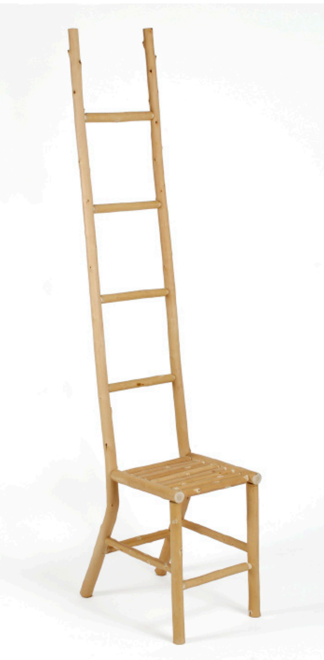
Chaise échelle en châtaignier, Godefroy de Virieu © Bernard Dupuy