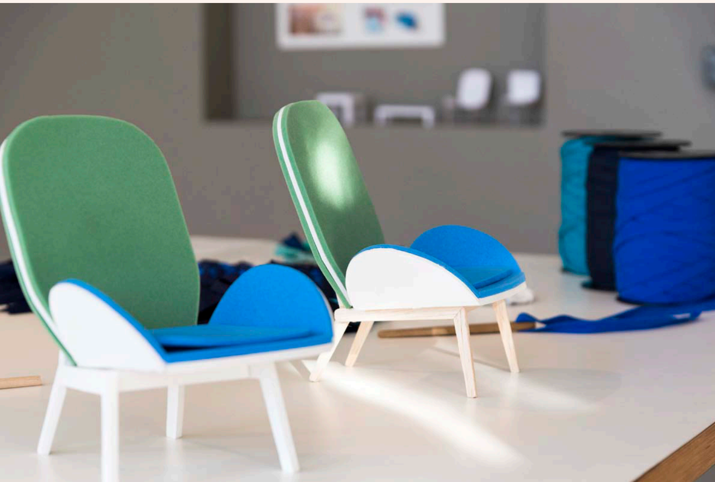
Maquettes Fauteuil Cerf, Les M Studio

Dispositif piloté par Le Pôle Expérimental des Métiers d'Art de Nontron et du Périgord Limousin Château, Avenue du Général Leclerc - 24 300 Nontron www.metiersdartperigord.fr