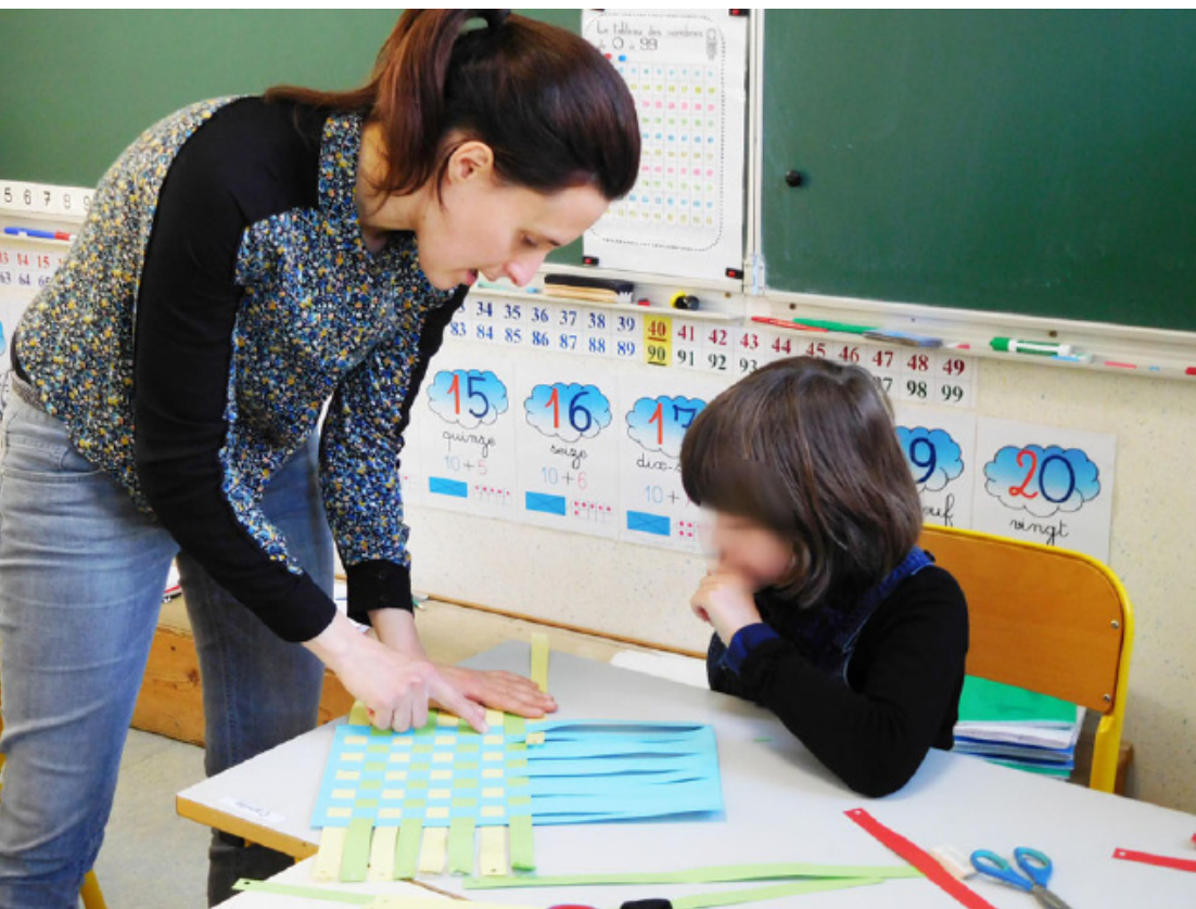
Intervention en milieu scolaire des M Studio

Elle contribue à la réussite et à l'épanouissement des jeunes.