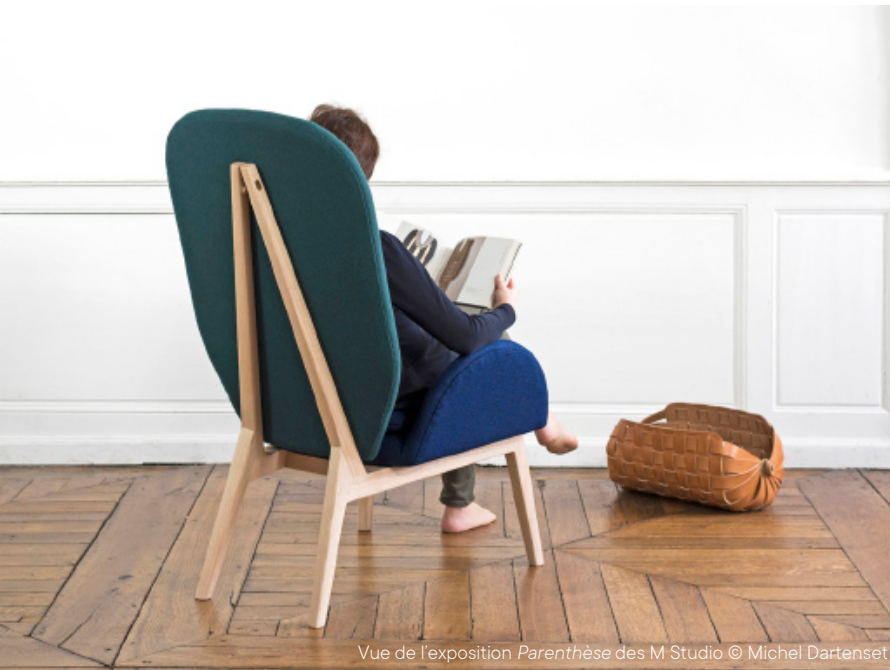
Vue de l'exposition Parenthèse des M Studio

Ce parcours s'appuie sur la collection Design et métiers d'art de l'Agence culturelle départementale Dordogne-Périgord, elle-même issue des résidences de designers qui ont lieu à Nontron depuis 20 ans, dans le cadre des « Résidences de recherche et de création ».