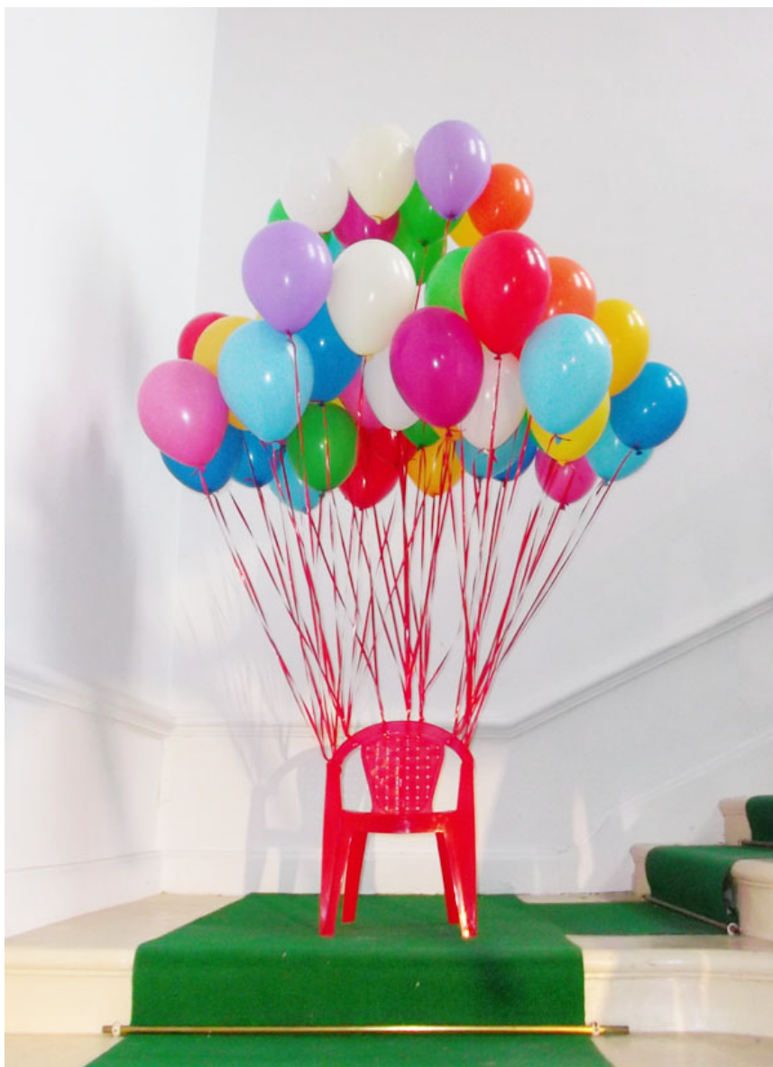
Créations d'élèves sur le thème Une assise avec une fonction en plus