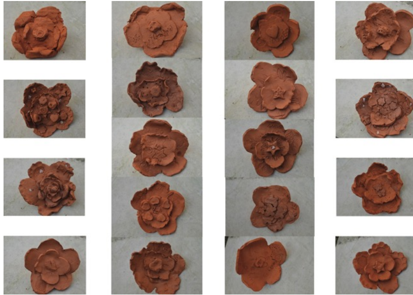
Fleurs réalisées par les élèves de moyennes et grandes sections maternelle de l'école de Bussière-Badil accompagnée par Céline Giry