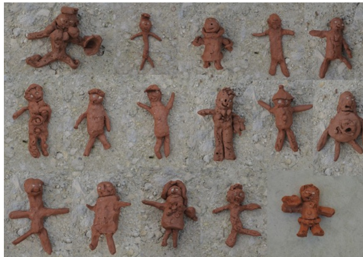
Poupée réalisée d'après le livre « Cropetite » de Michel Gay - par les élèves de moyennes et grandes sections maternelle de l'école de Bussière-Badil accompagnée par Céline Giry.