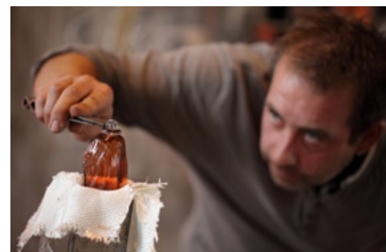
Photo 1 : panneau intérieur - MASUGUMI design/ Photo 2 : fabrication cire - Corbeille ZAWORE - Design Studio Monsieur/ Photo 3 : pose de l'attache d'une boule SILEX