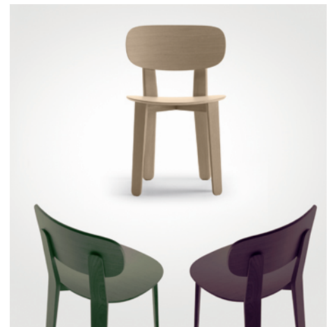
Air chair – VIA Chaise Triku – Alki