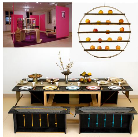
créations : metal crasset, Gidefroy de Virieu et Stefania Di Petrillo avec les professionnels métiers d'art de Nontron

Les acteurs associés à la résidence (partenaires institutionnels, éducation nationale, associations...) choisissent sa thématique et participent à la sélection du designer invité. Le designer est invité pour un séjour de recherche de trois mois.